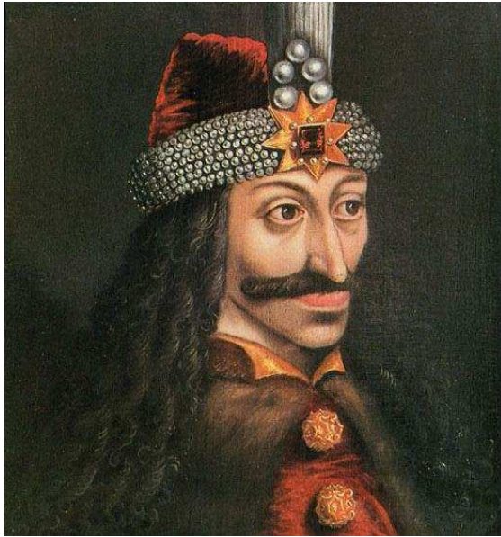
Vlad Draculea (1431-?)