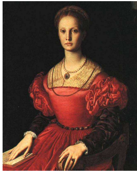
Erzsébet Báthory (1560-?)