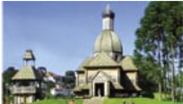
Igreja Ucraniana em Curitiba

Porque inúmeras igrejas e sepulcros, tem a forma arredondada em suas torres? Teriam algo relacionado com as inúmeras aparições de Esferas Luminosas a muito tempo atrás?